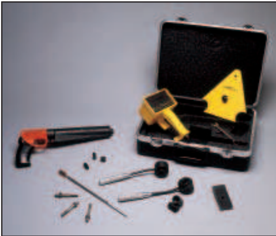
Sistema de Sonda Windsor HP.