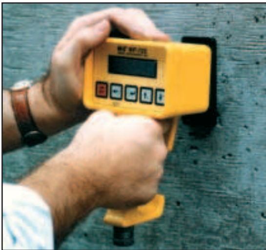
Front and Side View